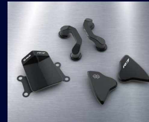
競技飾蓋組 BEB-FRCVK-00 建議售價：NT$ 9,800