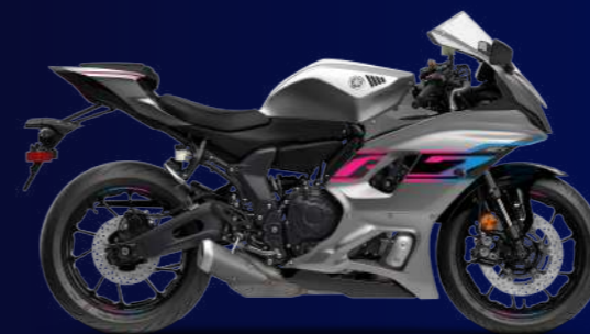
Matte Gray 幻影灰(淺灰深灰) I74DK1