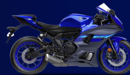
Racing Blue 競技藍(藍深灰/消光) I74BQ4