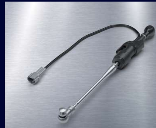
快排套件組 BEB-181A0-03 建議售價：NT$ 5,000