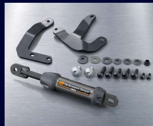
車身減震拉桿 BEB-211H0-11 建議售價：NT$ 8,500