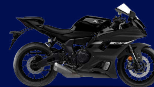
Midnight Black 疾勁黑(深灰黑/消光) I74AE1