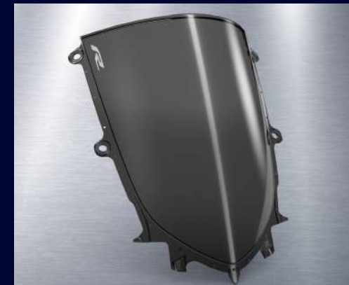
燻黑風鏡 BEB-261C0-00 建議售價：NT$ 2,300