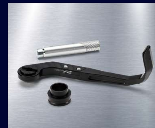
煞車拉桿護弓 BEB-FFBRP-00 建議售價：NT$ 5,900