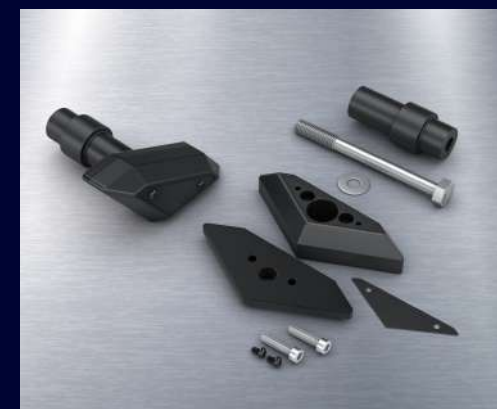
防倒滑塊 BEB-F11D0-V0 建議售價：NT$ 11,000