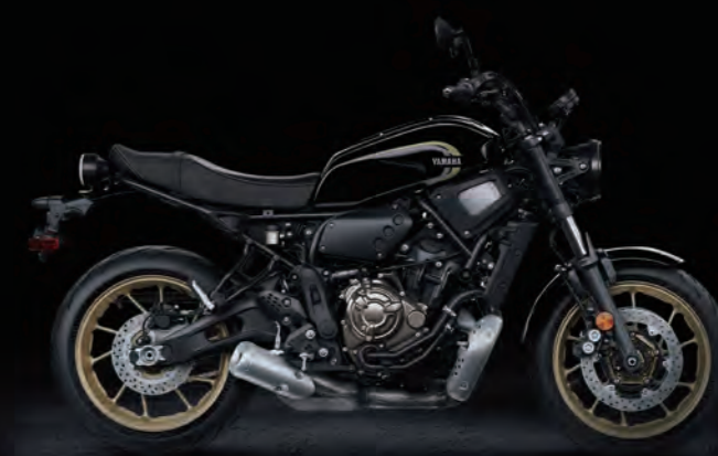
BLACK METALLIC X 黑 175061