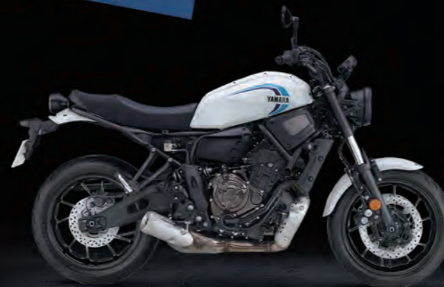
RADICAL WHITE 白 175051