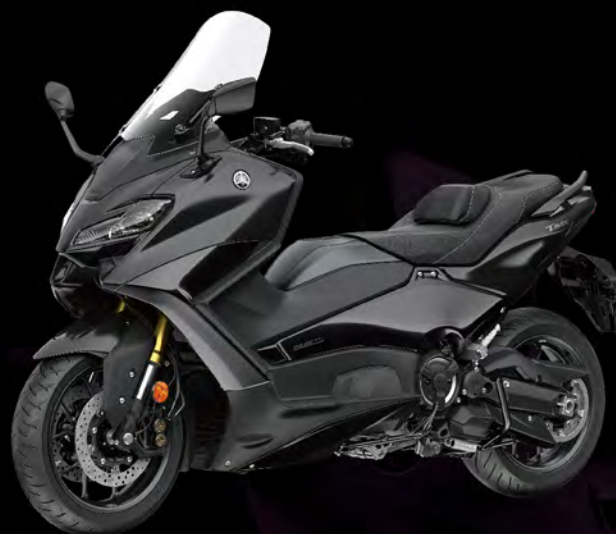
Tech Black 石墨黑 I80062 黑 (消光)