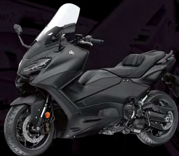
Sonic Grey 音速灰 I81AE3 深灰黑 (消光)