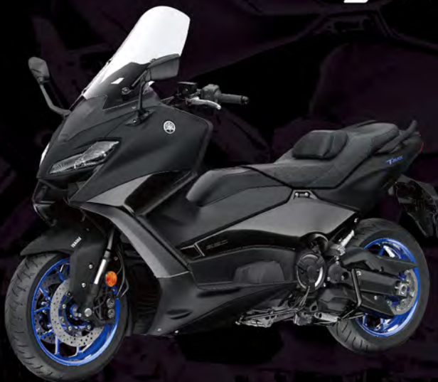
Icon Blue 藍曜黑 I81DJ1 黑藍 (消光)