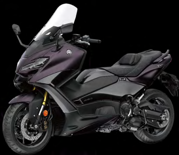
Dark Magma 熔岩紅 I80721 深紅深灰 (消光)