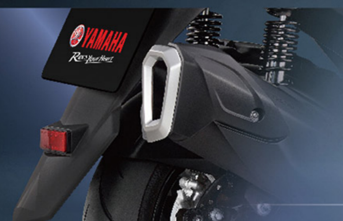
B8R-QE478-00 排氣管 鍍鉻質感飾蓋