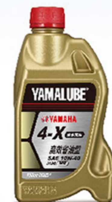
4-X 900 C.C.