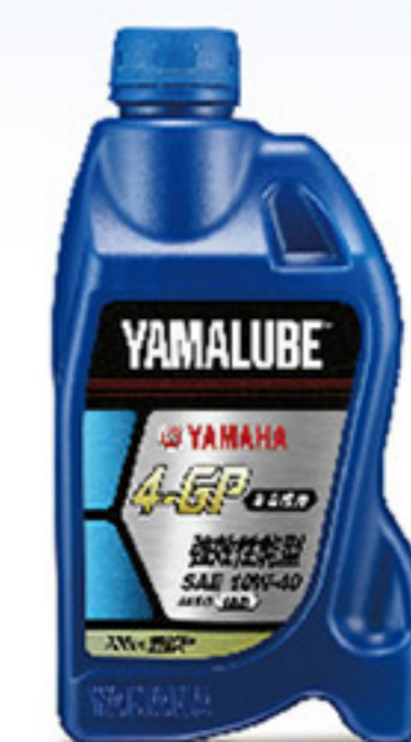
4-GP 900 C.C.