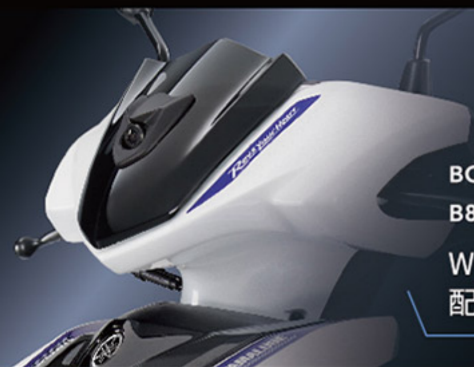
BCC-QHDVR-30 / B8R-QH215-10 / B8R-623KT-00 WiFi 雙鏡頭行車記錄器 / 配件組 / 專用開孔風鏡